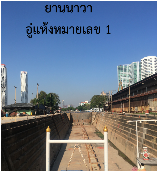
ยานนาวา อุ้งแห่งหมายเลข 1