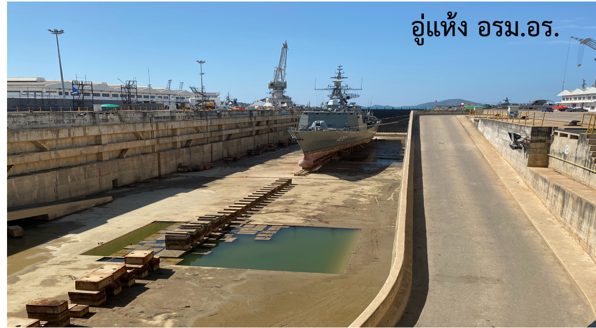
อุ้งแห่ง อรม.อร.