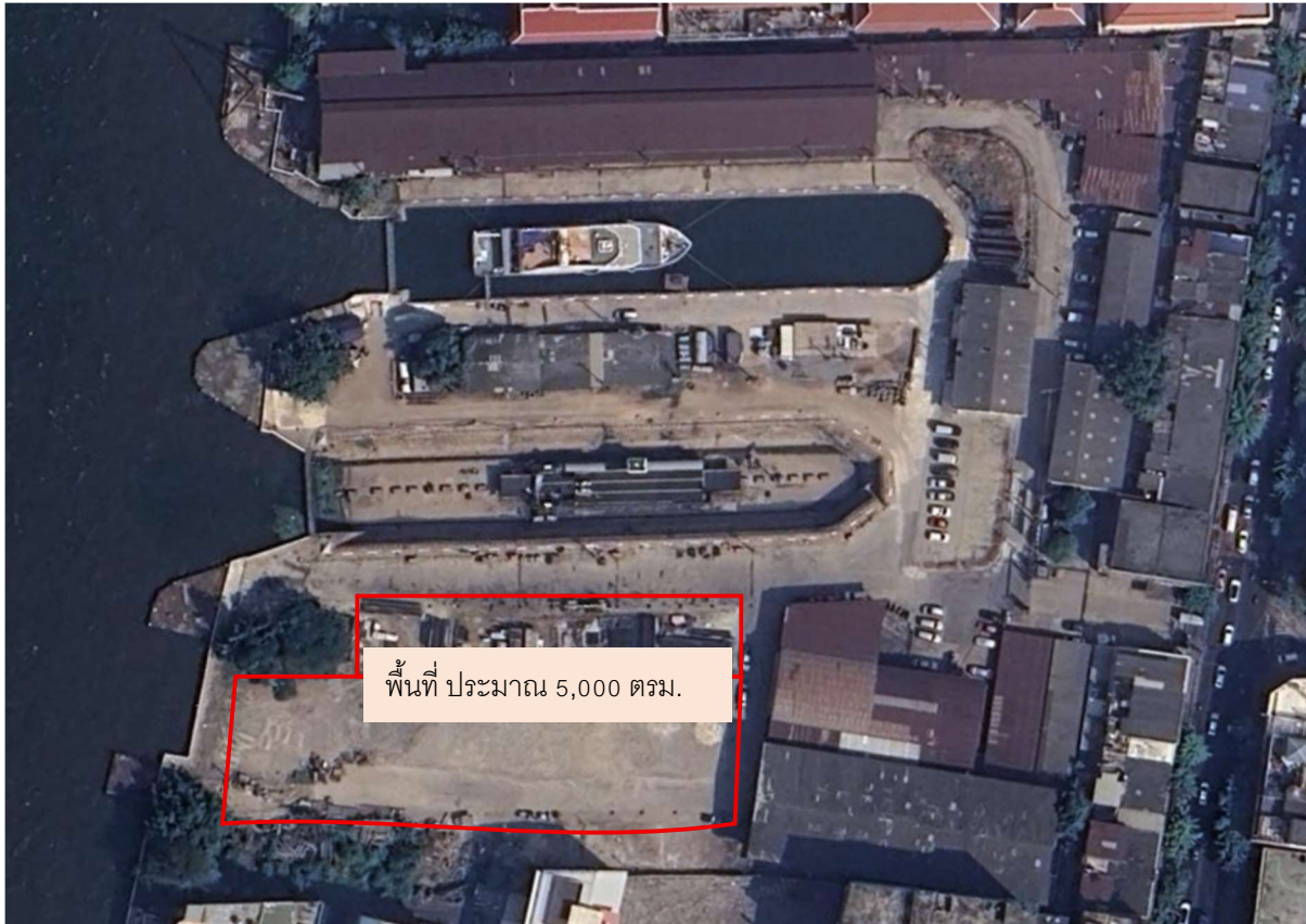
แผนผังแสดงพื้นที่ให้บริการ

บริษัท อู่กรุงเทพ จำกัด ตั้งอยู่เลขที่ 174/1 ถนนเจริญกรุง แขวงยานนาวา เขตสาทร กทม. ซึ่งมีพื้นที่ที่ปรับปรุงแล้ว พร้อมให้บริการ ทั้งหมดประมาณ 5,000 ตารางเมตร รายละเอียดตามแผนผังแสดงพื้นที่ให้บริการ